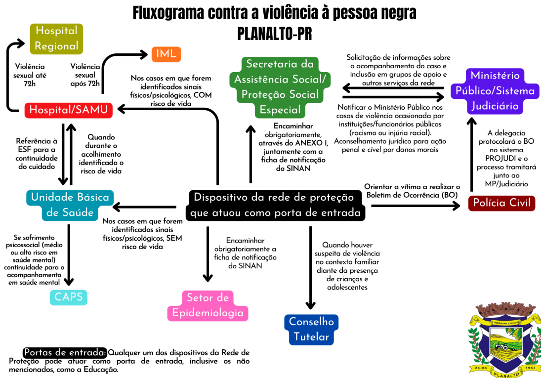
IMAGEM 6 - Fluxo resumido de combate à violência contra a pessoa negra