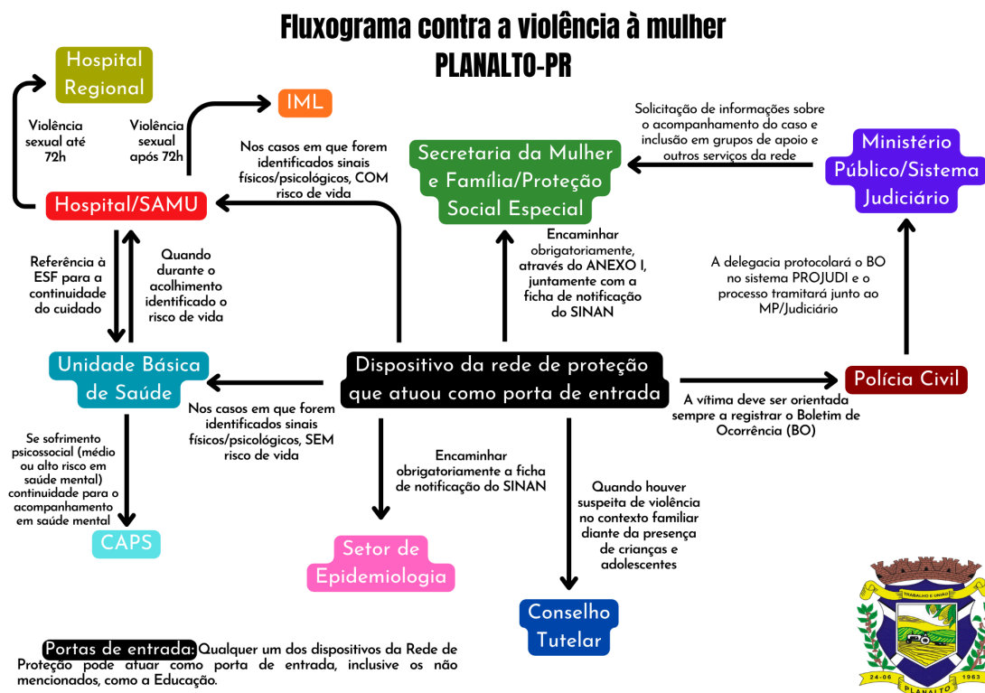
IMAGEM 1 - Fluxo resumido de combate à violência contra a mulher