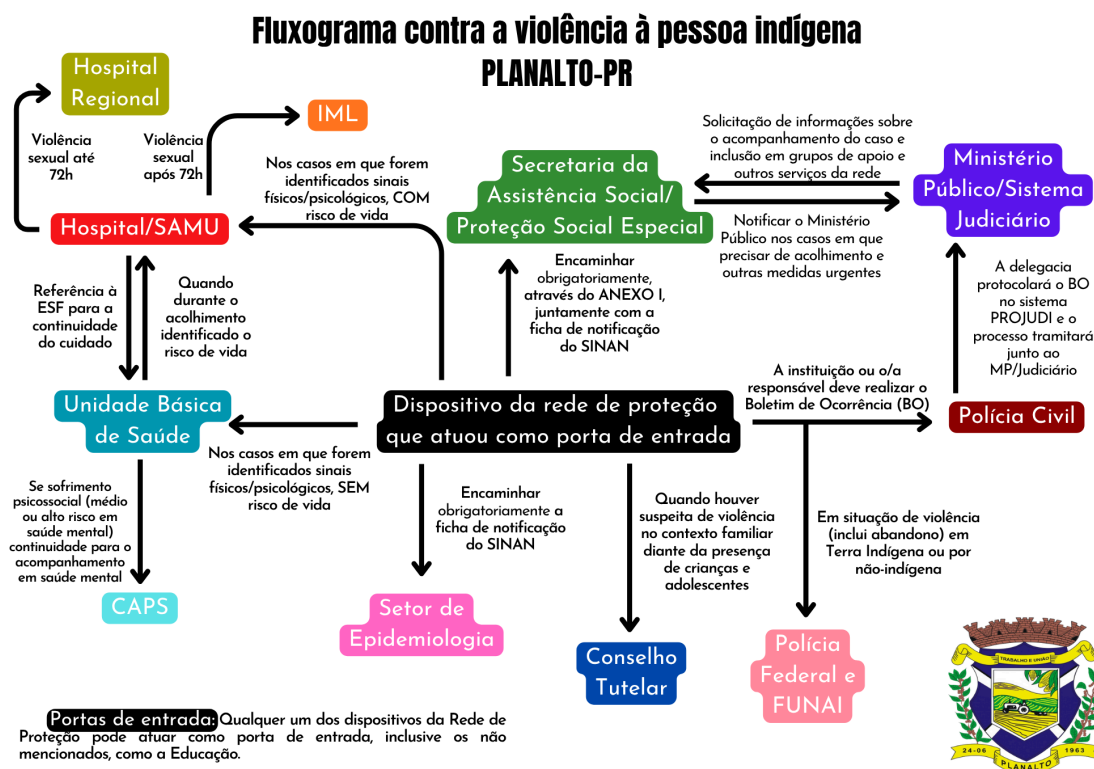
IMAGEM 5 - Fluxo resumido de combate à violência contra a pessoa indígena

Ministério Público Federal (MPF): O MPF possui a atribuição primária de zelar pelos direitos dos povos indígenas e deve ser notificado em casos graves, especialmente os de violência institucional ou de direitos coletivos.