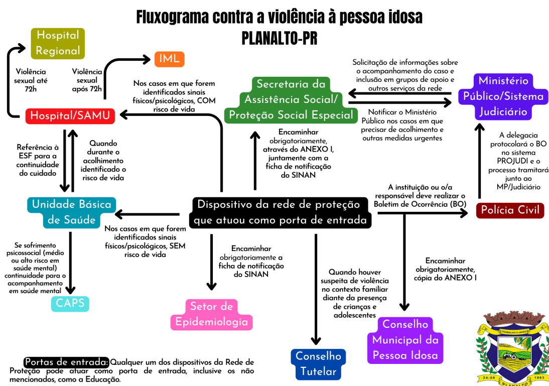
IMAGEM 2 - Fluxo resumido de combate à violência contra a pessoa idosa