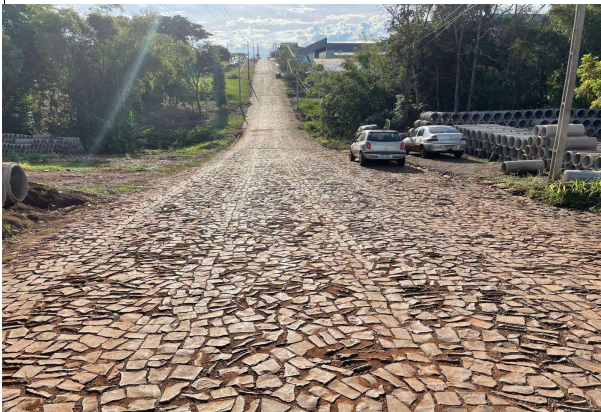
Rua nº 4 - Trecho II