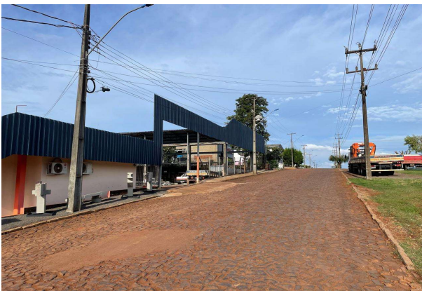
Rua nº 4 - Trecho 1