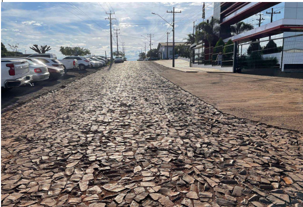
Rua nº 4 - Trecho 1