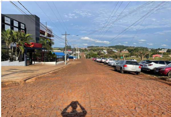
Rua nº 4 - Trecho 1