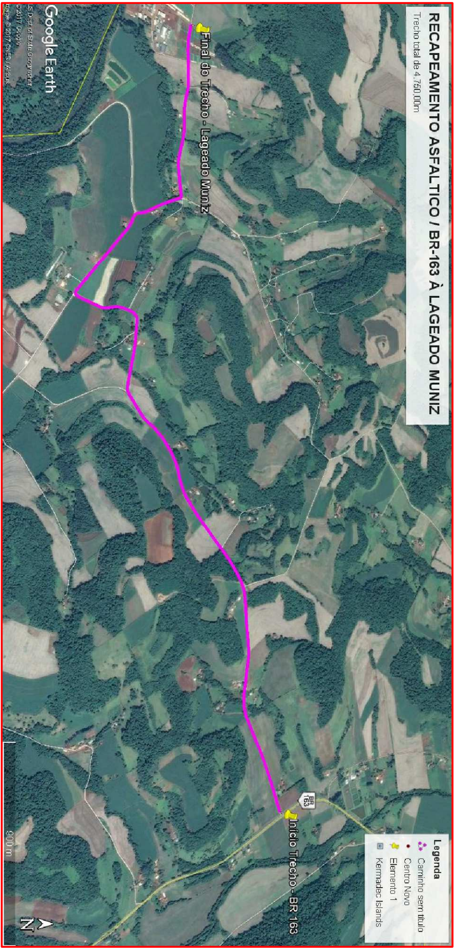
LOCALIZAÇÃO DO TRECHO SEM ESCALA