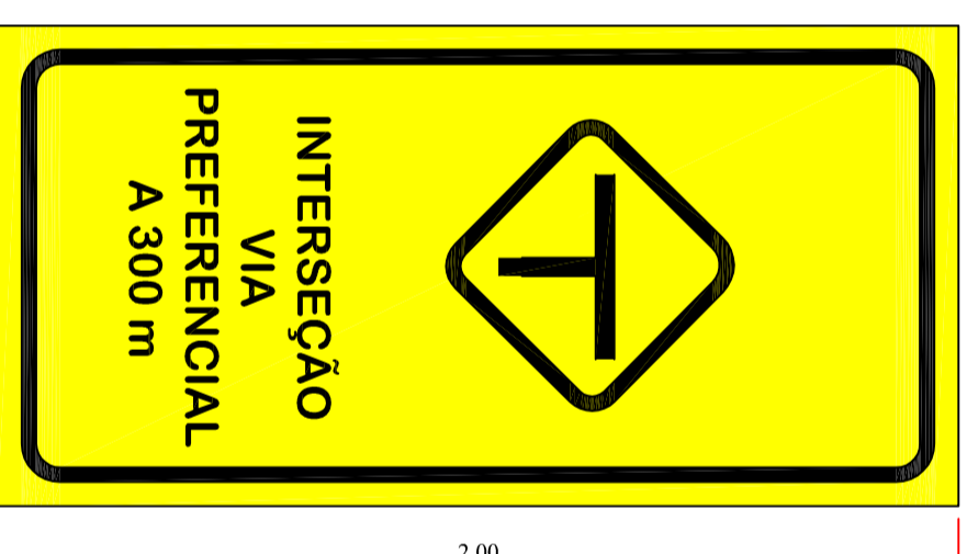
SINALIZAÇÃO VERTICAL INTERSEÇÃO COM VIA PREFERENCIAL