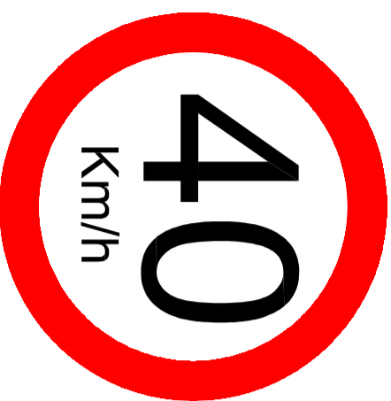
SINALIZAÇÃO VERTICAL - VELOCIDADE MÁXIMA NO TRECHO