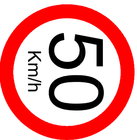
SINALIZAÇÃO VERTICAL - VELOCIDADE MÁXIMA NO TRECHO