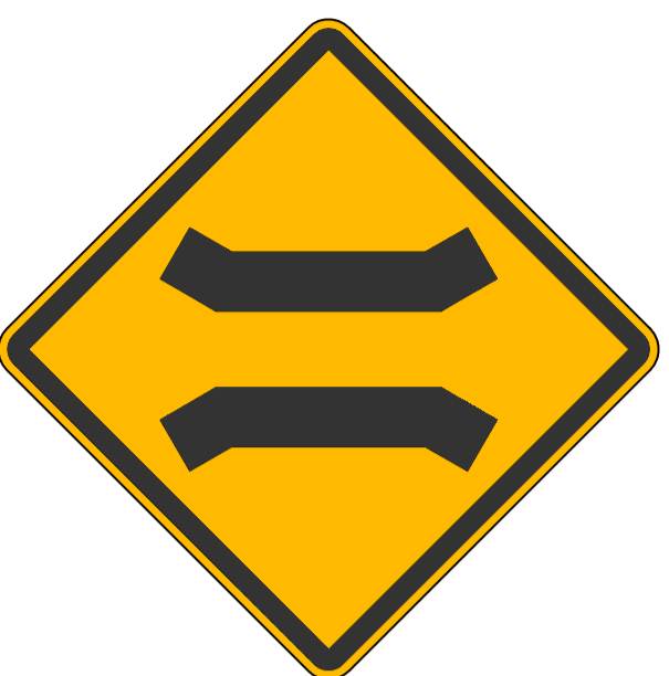
SINALIZAÇÃO VERTICAL - PONTE ESTREITA