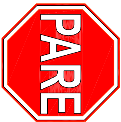
SINALIZAÇÃO VERTICAL - PLACA PARE